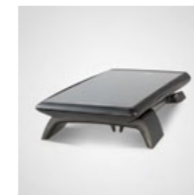
eBase zum Laden und für Software-Updates im Lieferumfang enthalten. Auch als tragbare Mini-POS verwendbar.