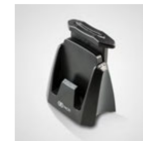
Dual-Akkulader mit Schonlade- und Schnellladefunktion.