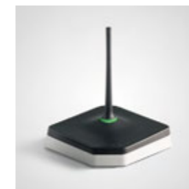
Orderman Funk: einzigartig stabil und sicher.