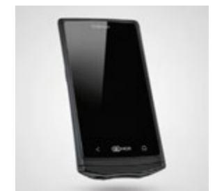
Orderman5+: Das Plus-Modell mit NFC-Leser (ideal für Zutrittssysteme) und Bluetooth zur Verwendung des Gürteldruckers.